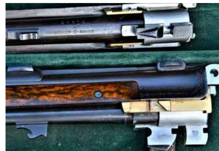
Kersten Verschluss med dubbla underliggande pipklackar och örön baktill på piporna som går in i baskylen och regleras där. Även utdragarna är guldförkyllda. Piporna är märkta Böhler Antini, som är ett högklassigt rostfritt stål.